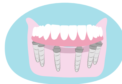
Prótese total sobre implantes